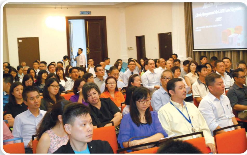
“分层地契管理法令之不可能的任务”讲座会吸引约113人出席。

上分层管理仲裁庭，面对罚款RM5000或监禁3年或两者兼施。而若拖欠者在被定罪后，执意不缴纳管理费，将被征收每日RM50的附加罚款。“以往，共管机构只能追讨拖欠六年以内的管理费，但在新法令下，追讨已无时间限制，共管机构甚至可追逾10年的管理费。此外，2013年分层管理法令、强化了对购屋者的保护，包括规定发展商在把钥匙交给购屋者时，就必须一并交上分层地契，但同时对拖欠管理费者设下更严厉的惩罚，旨在保护大部份住户的权益。