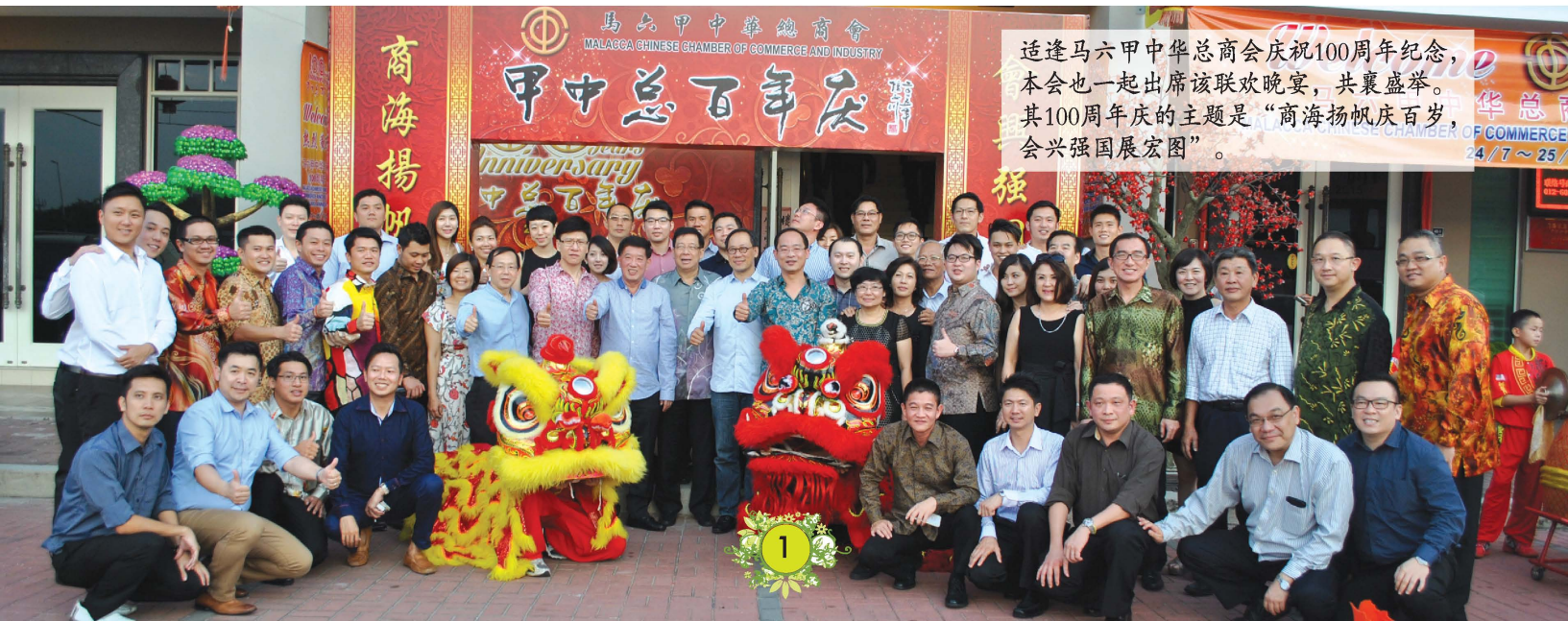
适逢马六甲中华总商会庆祝100周年纪念，本会也一起出席该联欢晚宴，共襄盛举。其100周年庆的主题是“商海扬帆庆百岁，会兴强国展宏图”。

此外，他表示中总吁请政府全面承认独中统考文凭，培养和留住更多掌握多种语文能力的本地人才，让他们在各领域各尽其能，各显其才，协助国家更快速前进。“人力资源是高效资本，是国家的第一发展资源，大马要实现2020年成为高收入先进国，大力培育本地人才，再转化和强化人力资源优势为关键。”