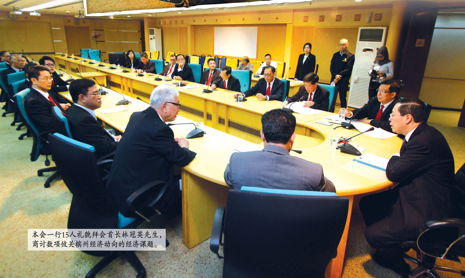
本会一行15人礼貌拜会首长林冠英先生，商讨数项攸关槟州经济动向的经济课题。