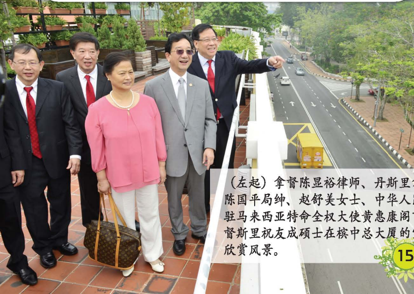
（左起）拿督陈显裕律师、丹斯里拿督斯里陈国平局绅、赵舒美女士、中华人民共和国驻马马来西亚特命全权大使黄惠康阁下、及拿督斯里祝友成硕士在檳中总大厦的空中花园欣赏风景。