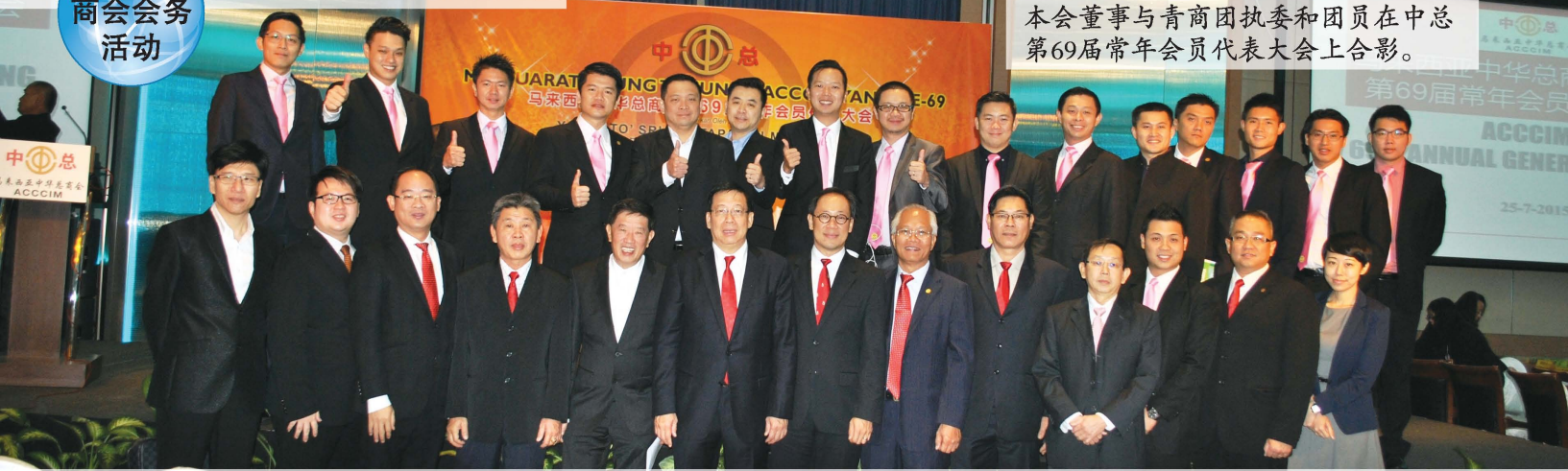
本会董事与青商团执委和团员在中总第69届常年会员代表大会上合影。