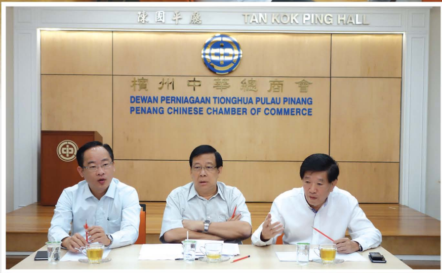
青商团顾问鼓励青商团执委通过青商团这个平台，努力建立自己的能力和人脉。