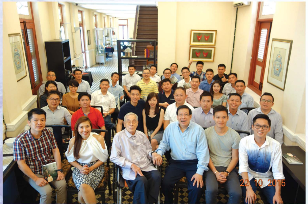
大家一起合照留念。