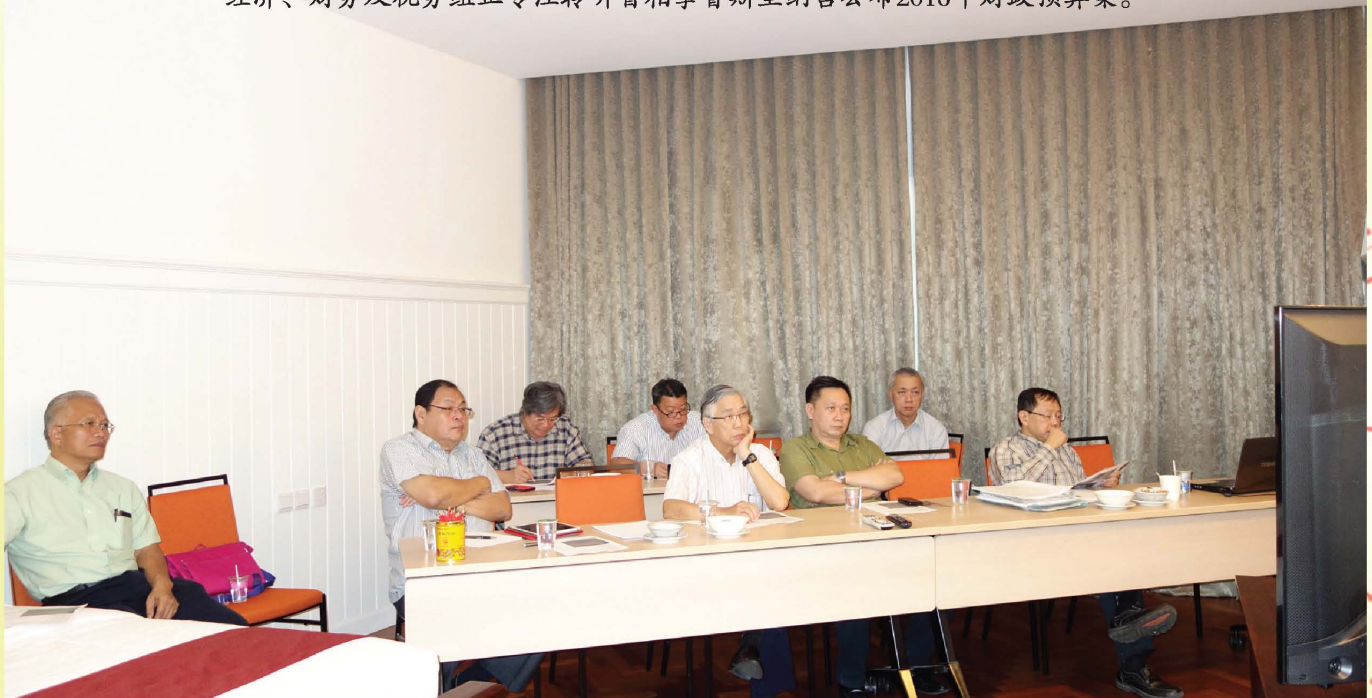
经济、财务及税务组正专注聆听首相拿督斯里纳吉公布2016年财政预算案。

As a whole, from the view point of the business community, the 2016 Budget does not sufficiently address the issue on the gloomy economic outlook. In this regard, we strongly urge the Government to implement immediate effective measures as the private sector is looking forward eagerly to the Government for guidance and also creating business opportunities.